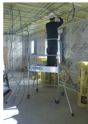
Rolly mini H. travail 2,90 m