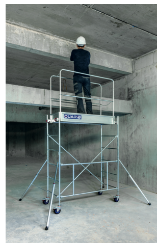
Rolly H. travail 3,80 m