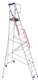
ERM 14 marches