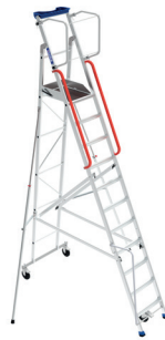
ERM 11 marches