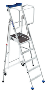
ERM 5 marches