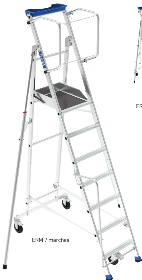
ERM 7 marches