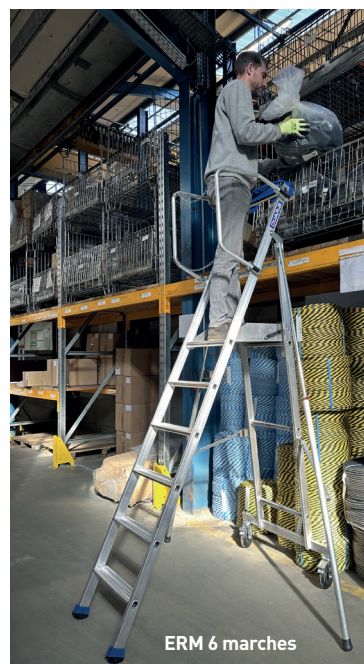
ERM 6 marches