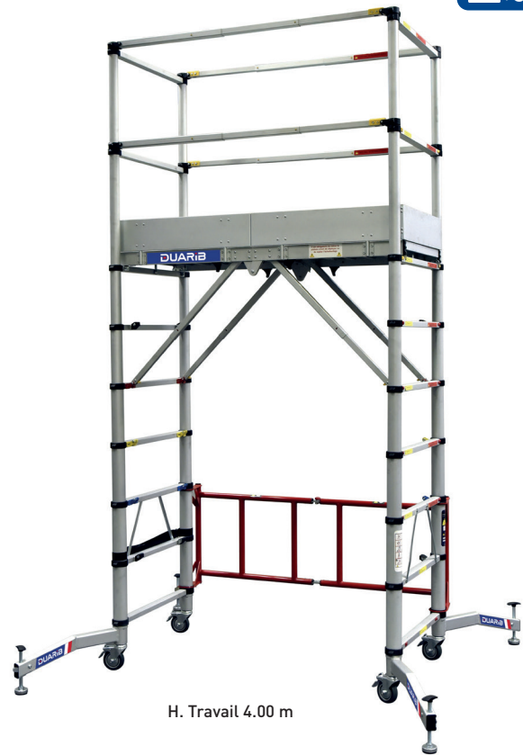
H. Travail 4.00 m