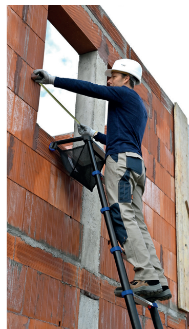
Space Bamboo 13 marches