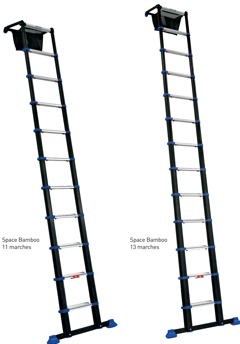
Space Bamboo 11 marches