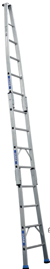
Échelle N 3 éléments