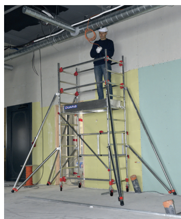
AL135 version base pliante Hauteur travail 3.80 m