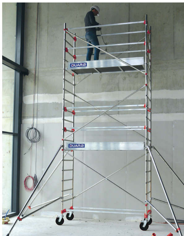
AL205 version standard. Hauteur travail 5.90 m