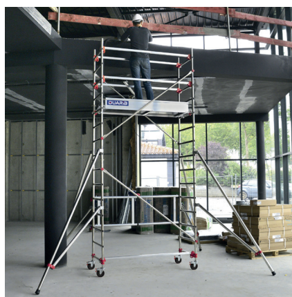
AL165 version base pliante Hauteur travail 4.80 m