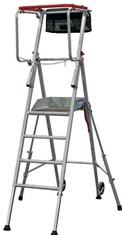
T PLIANT 5