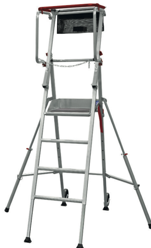
T PLIANT 6