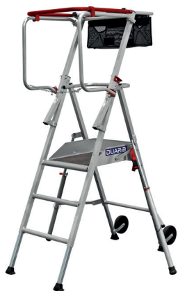
T PLIANT 4